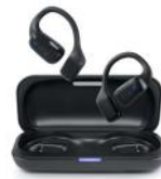
Écouteurs à conduction aérienne Muse