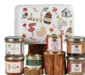
Coffret gourmand salé Sudreau