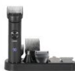
Set tondeuse multifonction Livoo