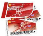
45€ en chèques UpCadhoc