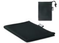
Serviette de sport 30 x 80 cm