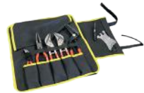
Trousse à outils à rouler Jouanel - Outils non inclus