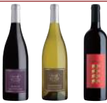
3 bouteilles* 2 Saint-Guilhem le Désert - Les Déesses Muettes dont 1 Cépage Merlot IGP 2023/24 et 1 Cépage Chardonnay IGP 2024/25 ; 1 Saint-Guilhem le Désert - Les Cochons, Cépage Marselan IGP 2022/23