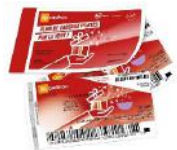
30€ en chèques UpCadhoc