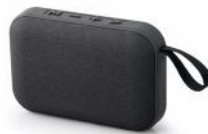
Enceinte Bluetooth* Muse - 5 W