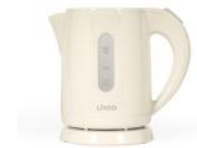
Mini bouilloire Livoo 0.8L sans fil