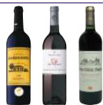
3 bouteilles* 1 Haut-Médoc - Château Beauséjour Hostens AOC 2019/20 ; 1 Montagne-Saint-Emilion - Clos du Pontet AOC 2019/20 ; 1 Saint-Emilion - Vieux Château Flouquet AOC 2020/21