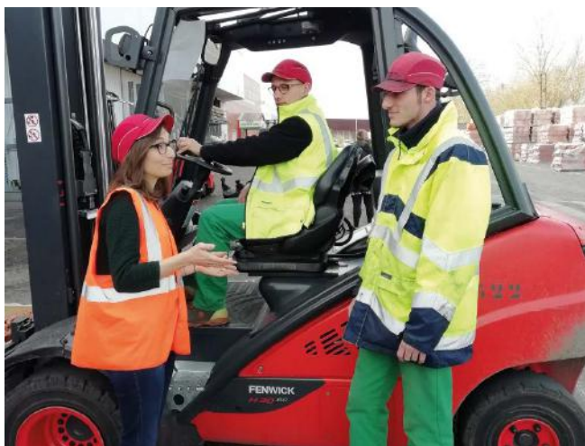
La sécurité sur le terrain

Bilan : Le nombre d'accidents du travail continue de baisser, avec une diminution de 13% en 2024 par rapport à 2023. Depuis 2021, le nombre d'accidents a baissé de 26%.