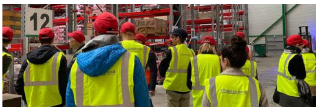
Journée des alternants - visite de la plateforme de Saint-Sulpice-la-Pointe (81)