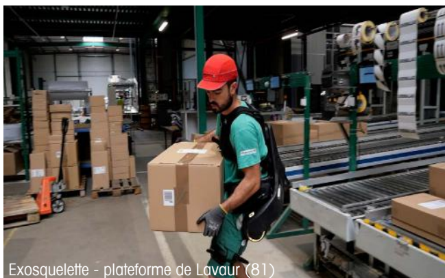
Exosquelette - plateforme de Lavour (81)