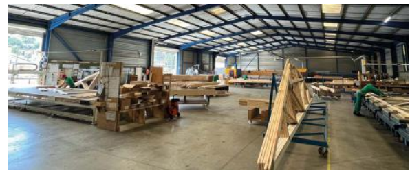
Usine de charpente d'Orthez (64)