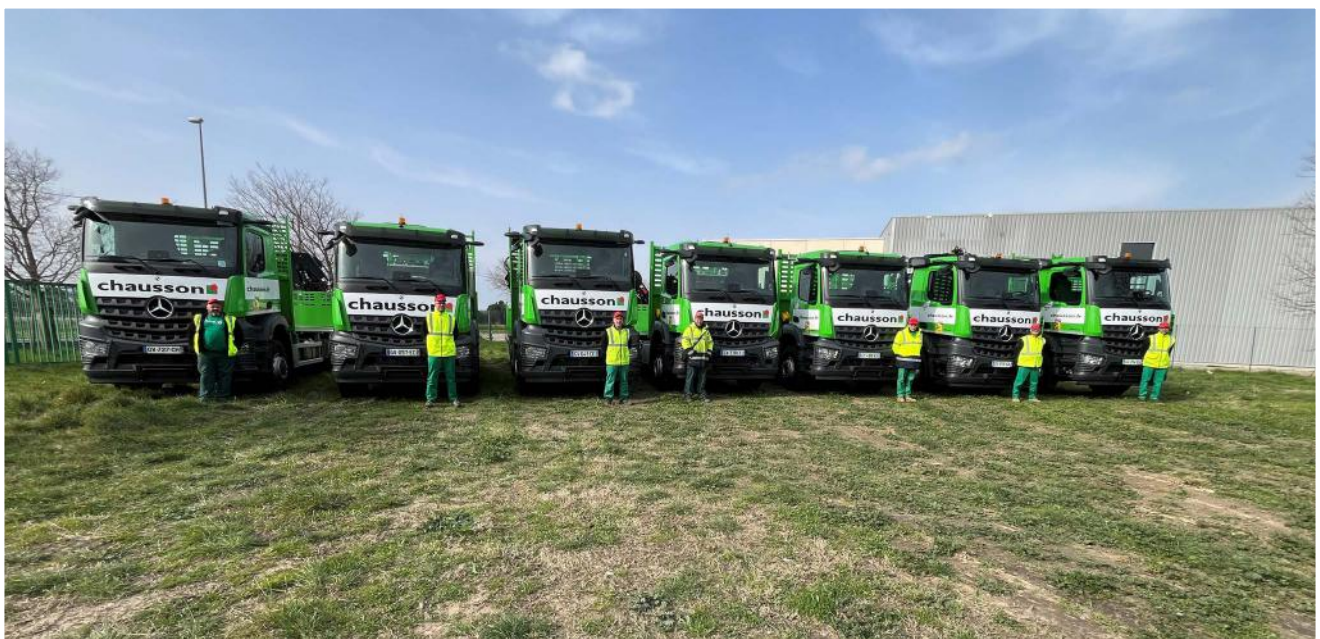
Livraison camions Saint-Paul-Trois-Châteaux