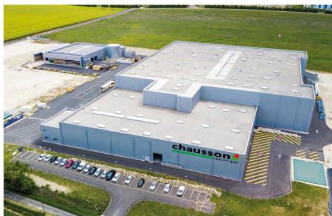
Plateforme de Saint-Jean d'Angély (17)