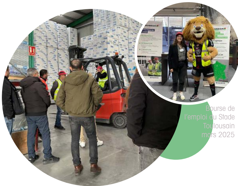
Bourse de l'emploi du Stade Toulousain mars 2025

Portes ouvertes Chausson Matériaux Aix les Milles, en partenariat avec France Travail Aix Vallée de l'Arc (mars 2025)