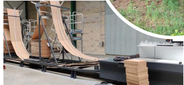
CVP impack - Plateforme de Lavar