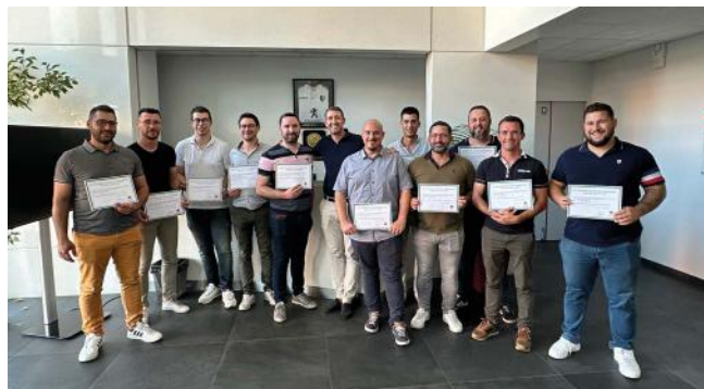
Première remise des diplômes - formation chef d'agence Occitanie