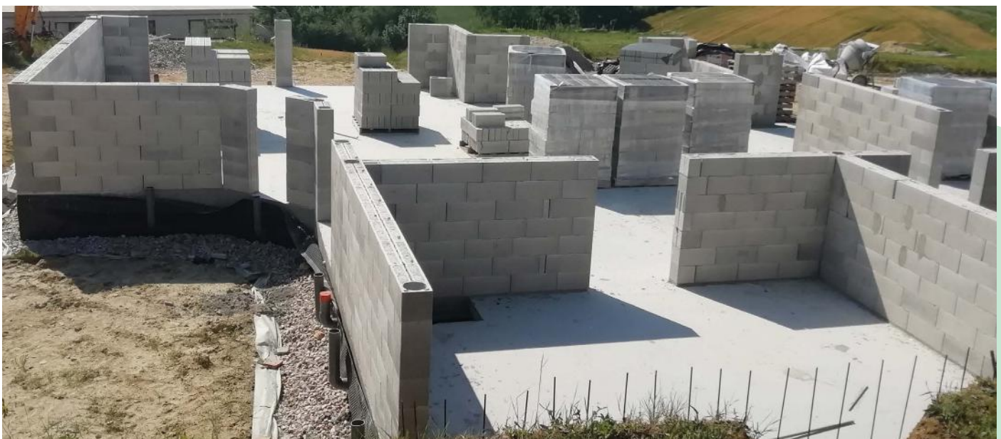
Chantier en blocs Airium