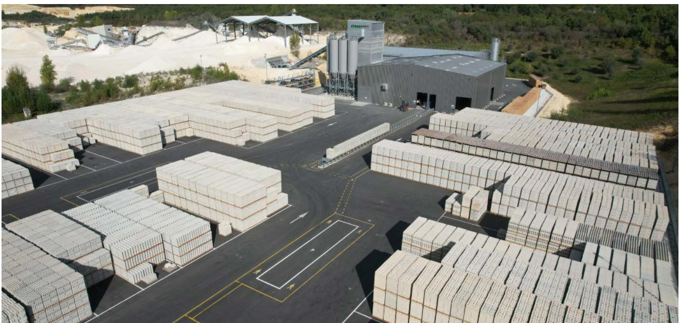
Usine de blocs de Bour-des-Maisons (24)