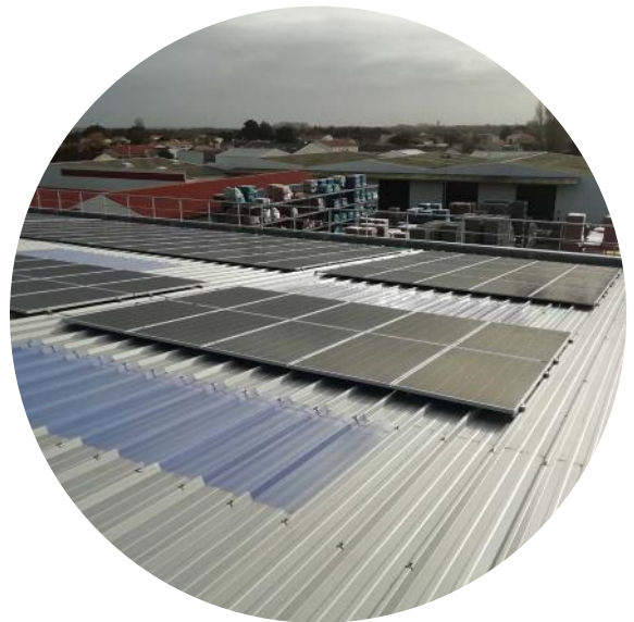
Panneaux photovoltaïques sur la toiture de l'agence de Saint-Pierre d'Oléron (17)