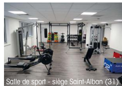
Salle de sport - siège Saint-Alban (31)