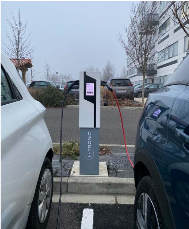
Bornes électriques pour voiture