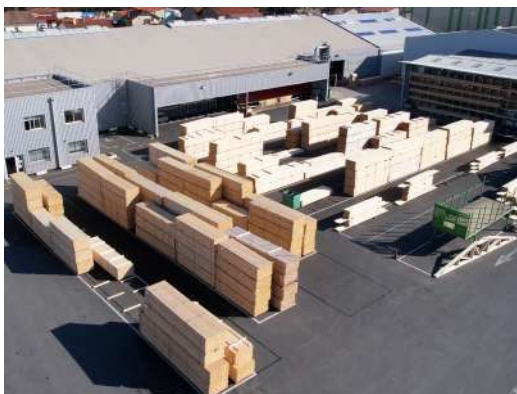
Usine de charpente - Lavour (81)