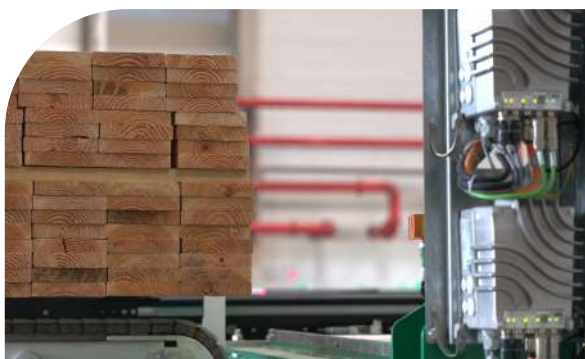
Plateforme de Saint-Jean d'Angély (17)