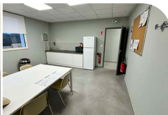
Salle de repos et salle de repas - agence de Quimper-Pluguffan (29)