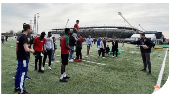
Bourse de l'emploi - Stade Toulousain