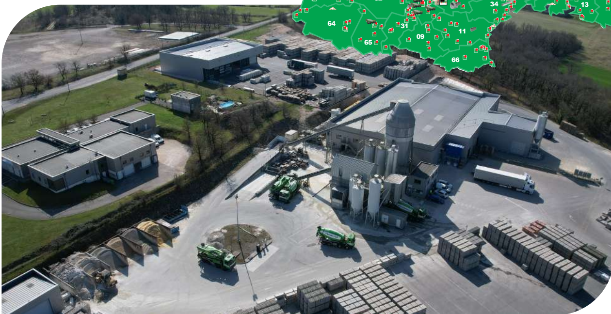
Usine de blocs et centrale BPE de Lalbenque (46)