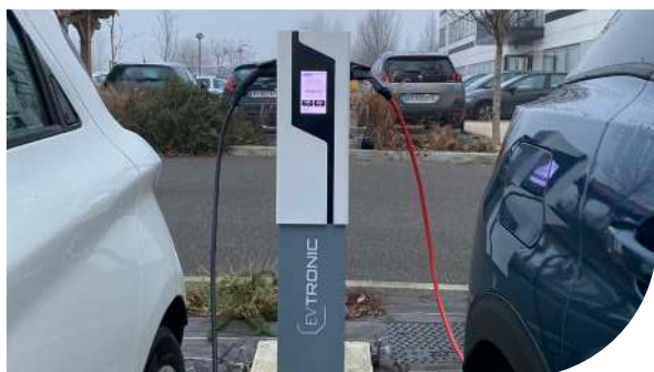
Bornes électriques pour voiture