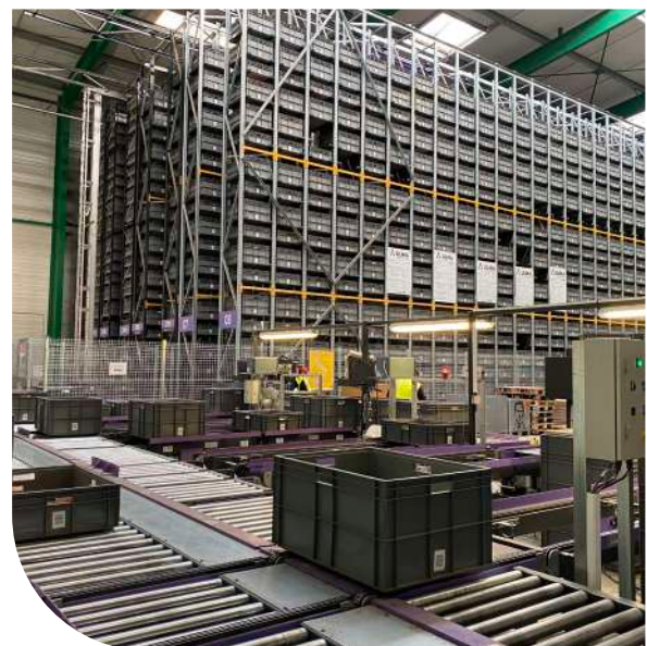
Plateforme automatisée - Lavour (81)