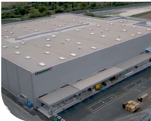
Base logistique - Saint-Jean d'Angély (17)