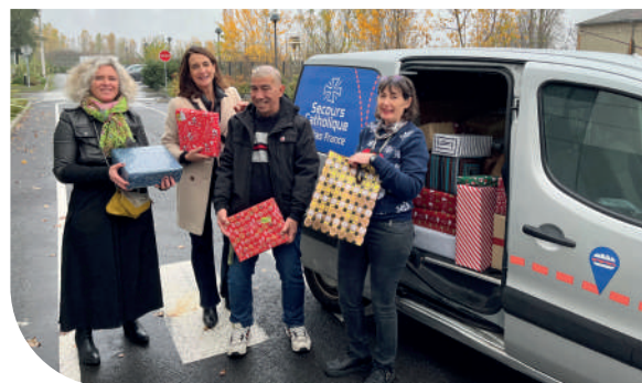
Collecte des boîtes de Noël