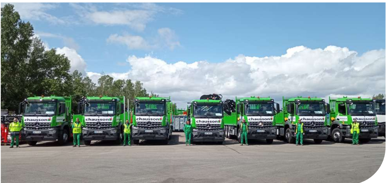
Livraison de camions bénéficiant des technologies Fleetboard et PPC- Toulouse (31)

R esponsabilisation, participation sont les maîtres mots qui définissent le projet d'une entreprise qui s'inscrit dans la durée et qui répond aux aspirations de l'ensemble de son personnel et de sa direction par un projet économe et responsable.