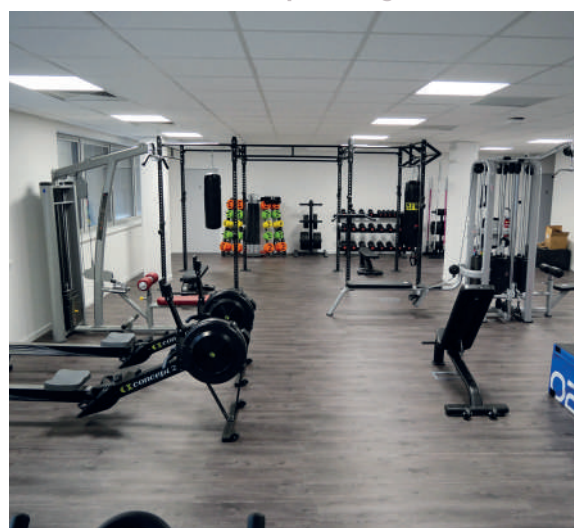
Salle de sport - siège Saint-Alban (31)