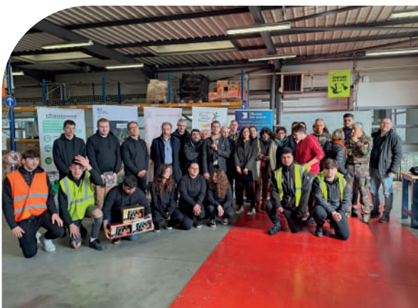
Rencontre logistique au lycée Pierre Mendès-France Vic-en-Bigorre (65)