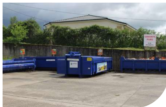
Usine de charpente - Fontenay-Le-Comte (85)