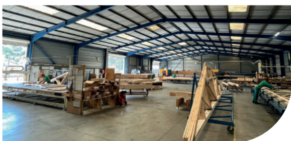
Usine de charpente d'Orthez (64)