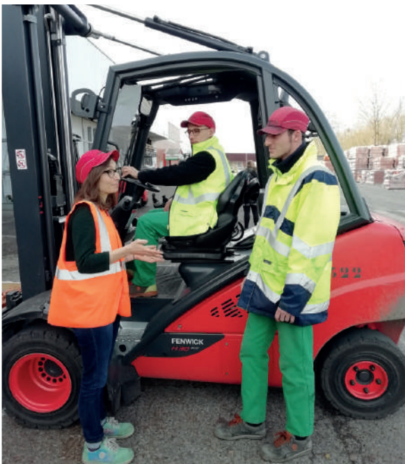
La sécurité sur le terrain