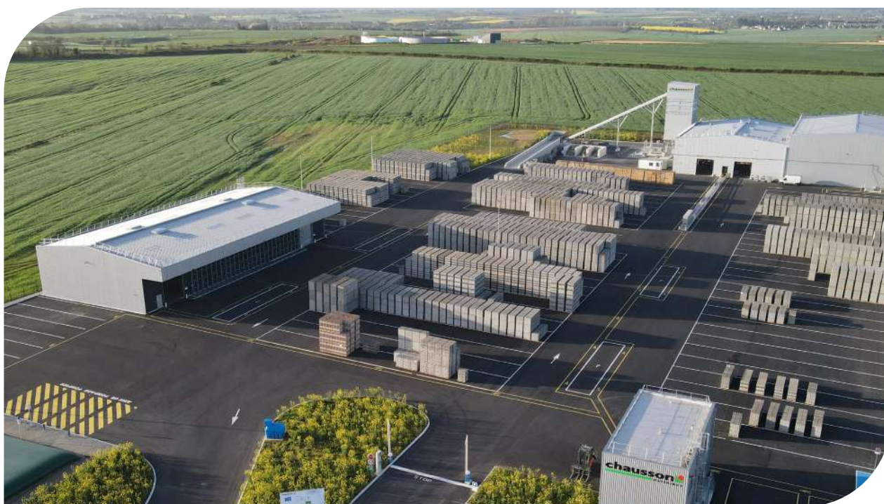
Usine de blocs de Sées (61)