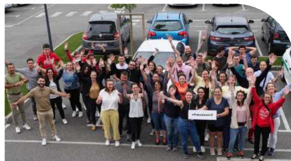
Départ de la marche connectée pour les Apprentis d'Auteuil

→ Organisation de collectes, bénévolat, insertions auprès des personnes en recherche de reprise d'activité, participation à des animations caritatives etc.