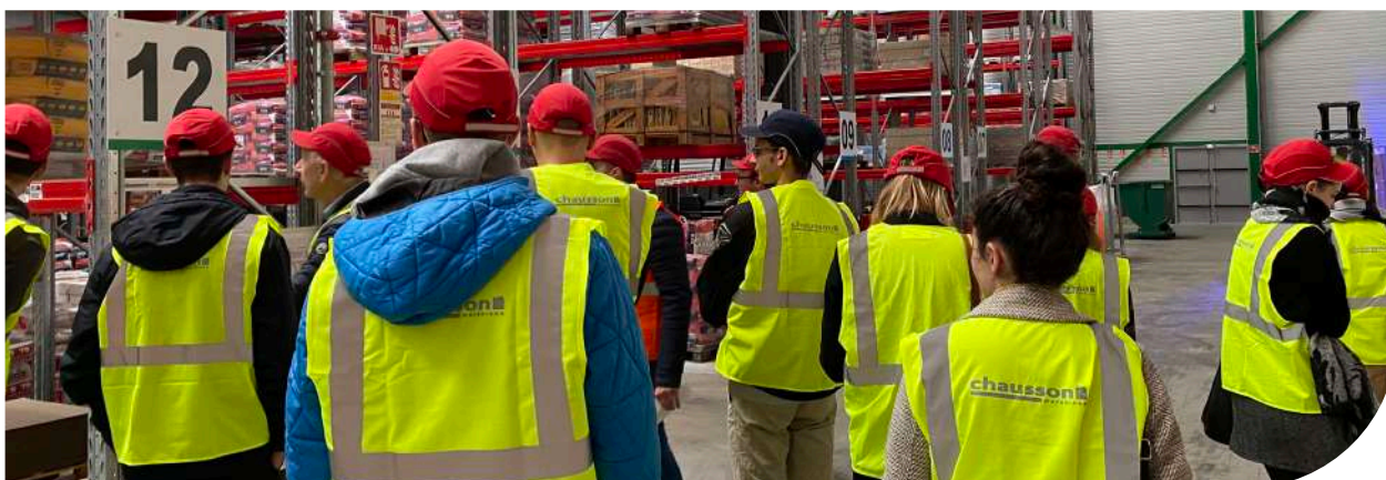
Journée des alternants - Visite de la plateforme de Saint-Sulpice-la-Pointe (81)